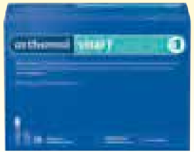
Orthomol Vital f®